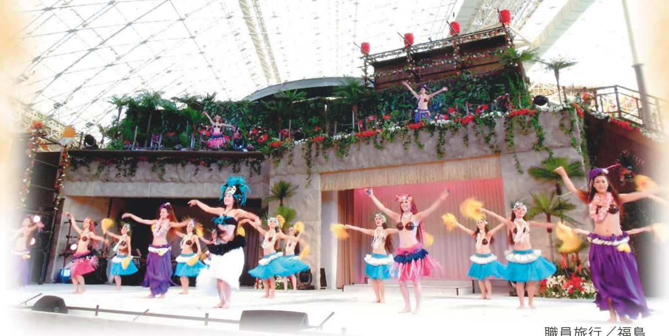
職員旅行／福島 スパリゾートハワイアンズにて