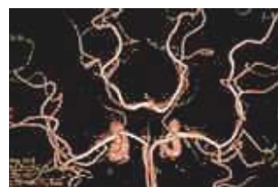
MRAによる脳動脈瘤の診断