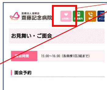
スマートフォン用