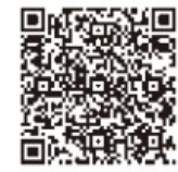
病院 QR コード